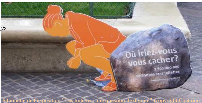
Silhouette de l'exposition "Les toilettes, une question de dignité"

L'eau & l'assainissement sont indissociables